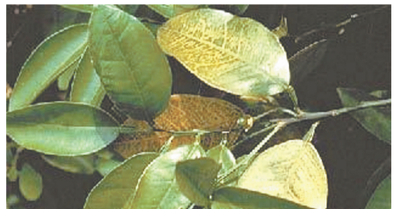
OÍD MORTALES EL GRITO SAGRADO, LIBERTAD, IGUALDAD, LIBERTAD, SALUD OÍD MOR-