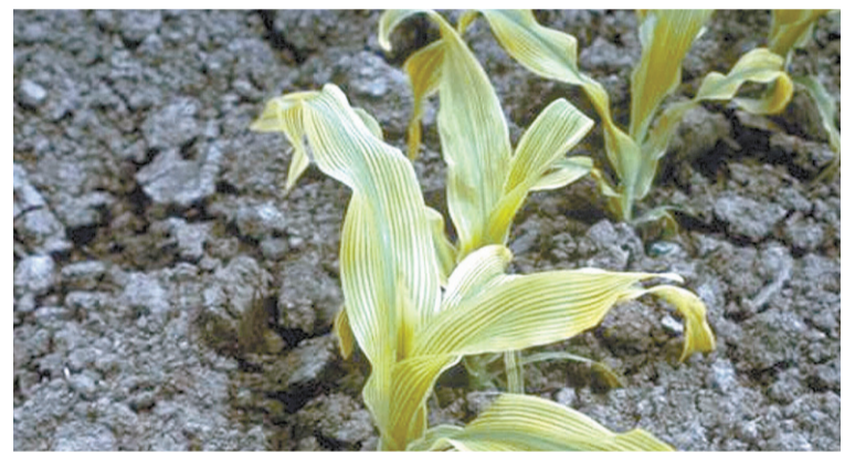
HOJAS CON DAÑO.

El desconocimiento de estos tres indicadores esenciales nos lleva a trabajar "a ciegas" sin saber las consecuencias de nuestro manejo. Sólo un suelo que contenga la biodiversidad microbiana adecuada será capaz de hacer que la planta logre expresar su potencial genético a nivel productivo y cualitativo y que tenga el suficiente vigor como para evitar el desarrollo de plagas y enfermedades.